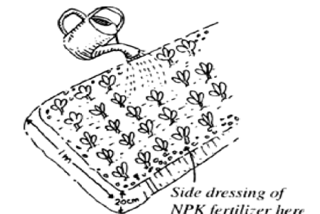
Taburkan baja NPK di tepi tapak