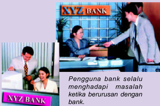
Pengguna bank selalu menghadapi masalah ketika berurusan dengan bank.