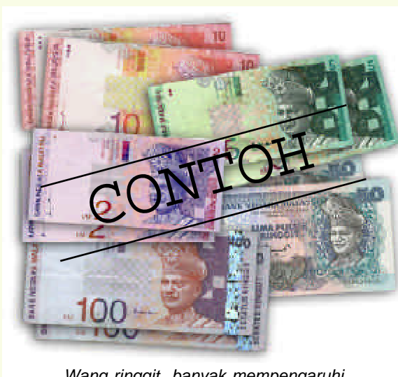
Wang ringgit banyak mempengaruhi kehidupan manusia hari ini

Namun, sebahagian besar pengguna pada hari ini tidak mengambil berat atas pertimbangan di antara harga dan kualiti sesuatu barangan semasa melakukan pemilihan asalkan barangan