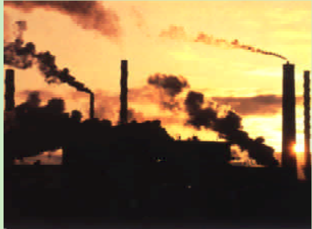
Asap yang dikeluarkan daripada kilang adalah satu penyumbang kepada gas rumah hijau.

Sejak awal hingga pertengahan tahun 1800-an, jumlah karbon dioksida dalam atmosfera telah meningkat kira-kira 25 peratus dan konsentrasi